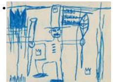
Auktion in Hamburg - Neues Katalogkonzept bewährt sich Ketterer Kunst Auktionen

• 7. DBD 2005 - Teilnehmer * Participants: Designbörse