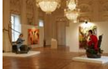
Tony Matelli mit seinen hyperrealistischen Figuren vor Gemälden von David Salle