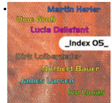
INDEX 05 _ Malerei kunst-raum, Raum für junge Kunst, Essen

• 7. DBD 2005 - Teilnehmer * Participants: Designbörse