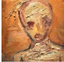
O.T. (Kopf) / Gustav Kluge